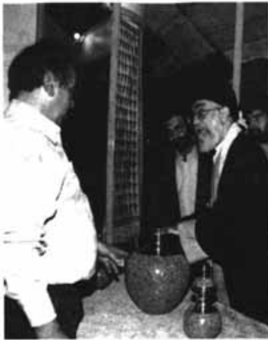
هنرمند کلیمی در غرفه صنایع دستی هنگام دیدار رهبرانقلاب