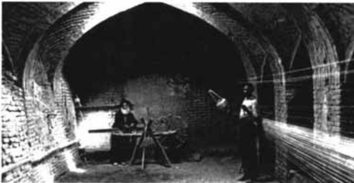
کارگاه «تن پیچیدن» ملا شیمون - جویباره اصفهان [از کتاب فرزندان استر]