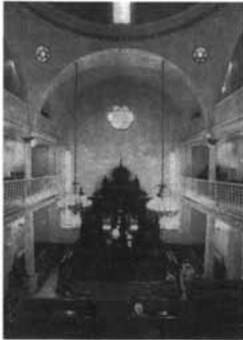
کنیسیای یوکسکالدیریم در استانبول

شش جشن عروسی شده‌اند. مخارج کمیته کمک به افراد کم بضاعت یهودی نیز توسط این افراد تامین می‌شود. علاوه بر آن هر هفته چهار تا پنج گروه نیز مسئول تهیه برنامه‌های تفریحی-آموزشی برای تعطیلات آخر هفته کودکان و نوجوانان یهودی هستند.