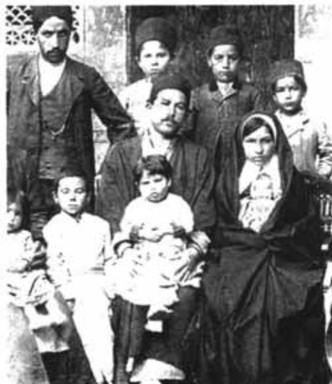
خانواده‌های سلوکی و متحده، اصفهان، ۱۳۰۴ شمسی

تاریخی، ورود آنان با فواصل زمانی، گاه طولانی و از مکان‌هایی گوناگون صورت گرفته است. چنان که «هرتسفلد» ورود یهودیان به ایران و به ویژه همدان و اصفهان را به اوایل سده چهارم میلادی،