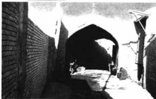
ورودی محله جویباره اصفهان [از کتاب فرزندان آستر]

بودند، به ویژه در زمان شاه عباس دوم (۱۰۳۸-۱۰۷۷ ه. ق) که تجاوزات و ظلم شاه و صدراعظم کینه‌جوی وی، محمدبیک، موجب گردید جمعیت یهودیان اصفهان که روزی دارالبهود نامیده می‌شد بر اثر قتل، گرایش به اسلام و یا ترک دیار به ۶۰۰ نفر برسد. ۵۵ شادرن