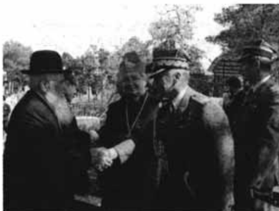
دیدار مقامات لهستانی با مرجع کلیه‌یان ایران در گورستان یهودیان تهران (مدفن عامه‌ای از یهودیان لهستانی) به مناسبت شصتمین سالگرد ورود آنان به ایران

در این مورد، روزنامه «جوئیش کروئیکل» چاپ فلسطین (۸ سپتامبر ۱۹۴۳) تحت عنوان «وضعیت کودکان یهود در ایران» مقاله‌ای به چاپ رساند که ذکر آن برای اطلاع‌یابی در مورد وضعیت یهودیان مهاجر لهستانی ضرورت دارد. در این روزنامه از تربیت کودکان یهودی مهاجر لهستانی در خانواده‌های یهودی تهران ذکر می‌شود و این که آنان به مدارسی می‌روند که در آن زبان عربی تکلم می‌کنند و آداب و رسوم یهودیان، به خصوص آیین روز شنبه، به آنان تعلیم داده می‌شود، ولی با عادات و سنت‌های یهودیان لهستانی تفاوت دارد. خبرنگار این روزنامه به قریه‌ای یهودی‌نشین در ایران رفته است که هر خانواده یکی دو نفر از آن کودکان را پذیرفته بودند و آنان را تربیت می‌کردند. (ایران ۸۲/۴/۵)