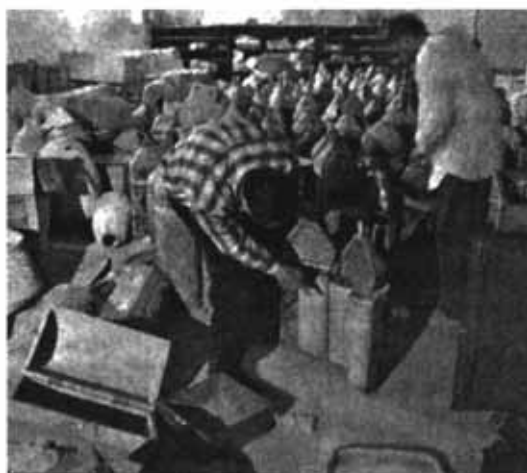
تومارهای دستنویس تورات در موزه ملی عراق مورد غارت قرار گرفتند.